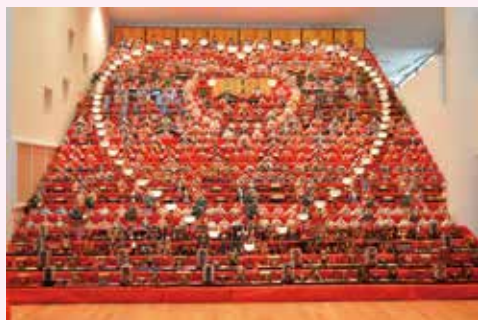
●世界の民俗人形博物館●

臥竜公園(がりゅうこうえん)は、日本さくら名所100選、日本の名松100選、長野の自然100選に選定されている。池の周りには"ソメイヨシノ"を中心に160本、公園全体で約800本の桜が楽しめます。