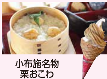
小布施名物 栗おこわ

須坂の早春の風物詩。高さ6m、30段飾り豪華絢爛1000体のひな人形の他にも、世界100数カ国の民俗人形およそ3000体あまりを所蔵、公開しています。